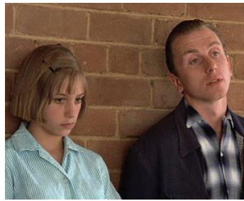
1988 UN MONDE À PART (A World apart) de Chris Mendes avec Jodhi May