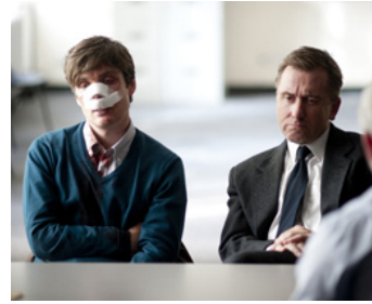
2012 BROKEN (Broken) de Rufus Norris avec Cillian Murphy