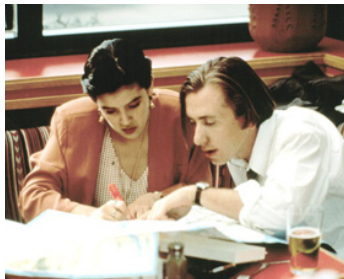
1993 UNE PAUSE, QUATRE SOUPIRS (Bodies, Rest and Motion) de M. Steinberg avec Phoebe Cates