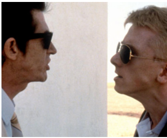
1984 THE HIT (The Hit) de Stephen Frears avec John Hurt