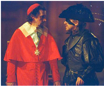
2001 D'ARTAGNAN (D'Artagnan) de Peter Hyams avec Stephen Rea