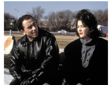
1994 LITTLE ODESSA (Little Odessa) de James Gray avec Moira Kelly