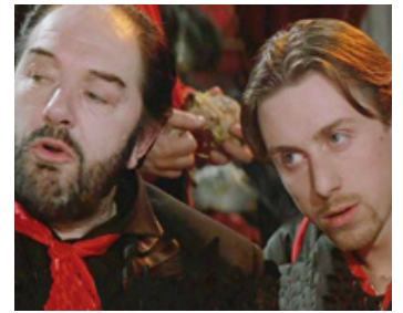
1989 LE CUISINIER, LE VOLEUR, SA FEMME ET SON AMANT de P. Greenaway avec Michael Gambon