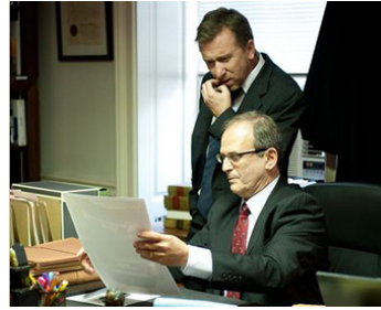
2012 ARBITRAGE (Arbitrage) de Nicholas Jarecki avec Tibor Feldman