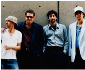
2000 BREAD AND ROSES (Bread and Roses) de Ken Loach avec Adrien Brody