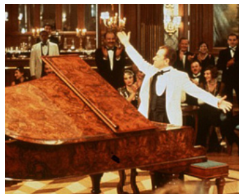
1999 LA LÉGENDE DU PIANISTE SUR L'OcéAN ((The Legend of 1900) de Giuseppe Tomatore