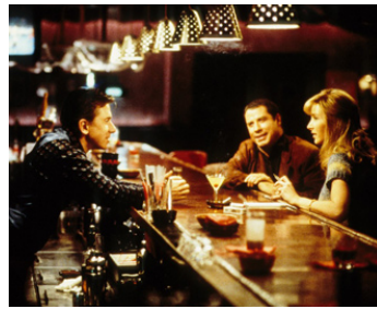
2000 LE BON NUMÉRO (Lucky Numbers) de N.Ephron avec John Travolta, Lisa Kudrow