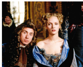
2000 VATEL (Vatel) de Roland Joffé avec Uma Thurman