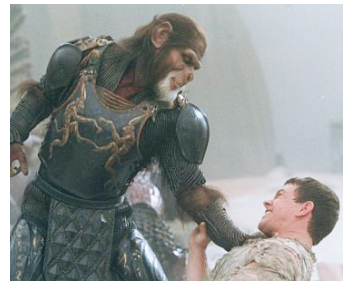
2001 LA PLANÈTE DES SINGES (Planet of the Apes) de Tim Burton avec Mark Wahlberg