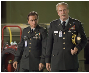
2008 L'INCROYABLE HULK (The Incredible Hulk) de Louis Leterrier avec William Hurt