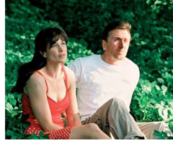
2005 LE DERNIER SIGNE (The last Sign) de Douglas Law avec Andie MacDowell