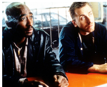
1997 GRIDLOCK'D (Gridlock'd) de Curtis Hall avec Tupac Shakur