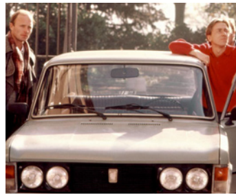
1988 LE COMLOT (To kill a priest) de Agneszka Holland avec Ed Harris