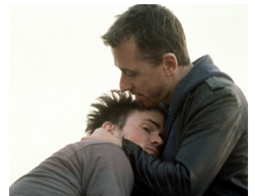
2000 THE MILLION DOLLAR HOTEL de Wim Wenders avec Jeremie Davies