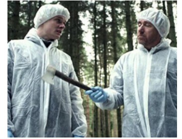
2012 LIABILITY (The Liability) de Craig Viveiros avec Jack O'Connell