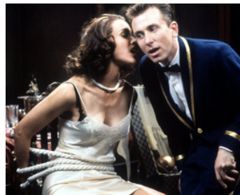
1995 GROOM SERVICE (Four Rooms) de Quentin Tarantino avec Jennifer Beals