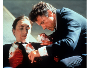
1992 RESERVOIR DOGS (Reservoir Dogs) de Quentin Tarantino avec Harvey Keitel