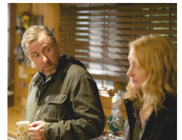
2014 OCTOBER GALE (October Gale) de Ruba Nadda avec Patricia Clarkson