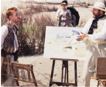
1990 VINCENT ET THÉO (Vincent & Theo) de Robert Altman avec Gérard Depardieu