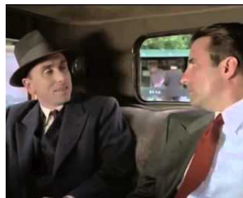
1997 LE SEIGNEUR DE HARLEM (Hoodlum) de Bill Duke avec Andy Garcia