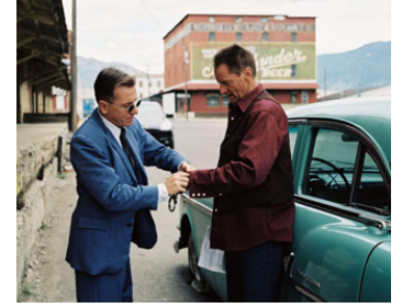
2005 DON'T COME KNOCKING (Don't come knocking) de Wim Wenders avec Sam Shepard