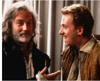
1990 ROSENCRANTZ ET GUILDENSTERN (R & G are dead) de T. Stoppard avec R. Dreyfuss