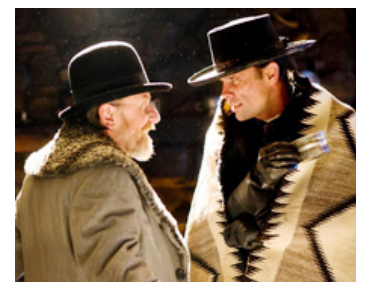
2015 LES HUIT SALOPARDS (The Hateful Eight) de Quentin Tarantino avec Walton Goggins