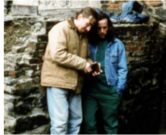
1991 JUMPIN' AT THE BONEYARD de Jeff Stanzler avec Alexis Arquette