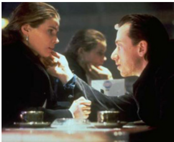
1994 AMOUR CAPTIF (Captives) de Angela Pope avec Julia Ormond