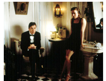
1997 LE SUSPECT IDÉAL (Deceiver) de Jonas Pate avec Renée Zellweger