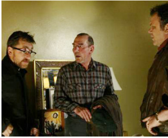
2006 DARK WATER (Dark Water) de Walter Salles avec Pete Postlewaite, John C. Reilly