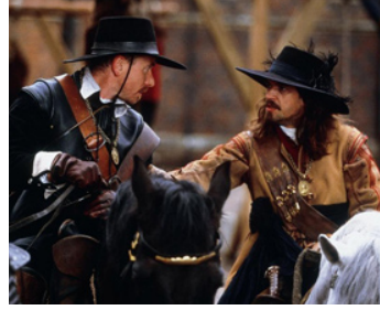
2003 LA MORT D'UN ROI (To kill a King) de Mike Barker avec Dougray Scott