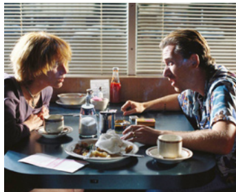
1994 PULP FICTION (Pulp Fiction) de Quentin Tarantino avec Amanda Plummer