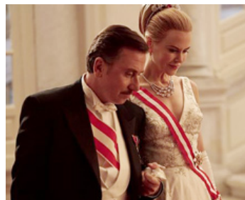
2014 GRÂCE DE MONACO (Grace of Monaco) d'Olivier Dahan avec Nicole Kidman