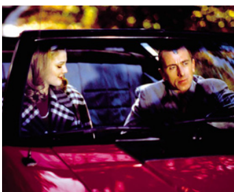
1996 TOUT LE MONDE DIT I LOVE YOU (Everyone says I love you) de W. Allen avec Drew Barrymore