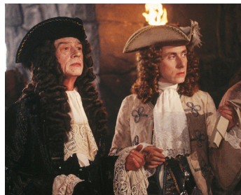
1995 ROB ROY (Rob Roy) de Michael Caton-Jones avec John Hurt